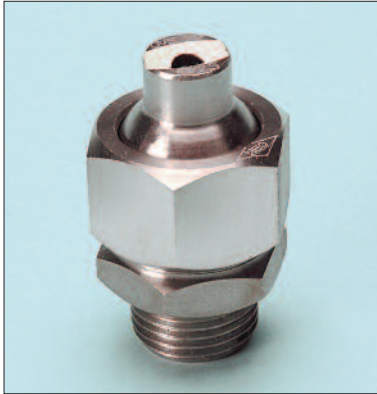
Tipo / Type OVS y