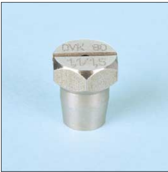
Tipo / Type OVKIR