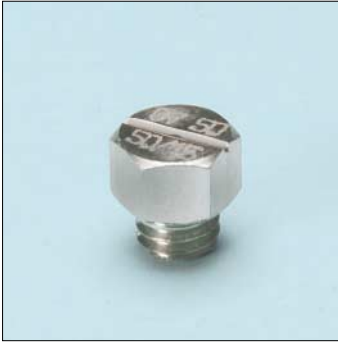
Tipo / Type OVK