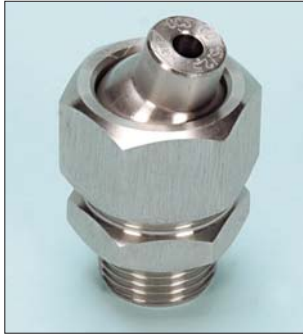
Tipo / Type OCS y