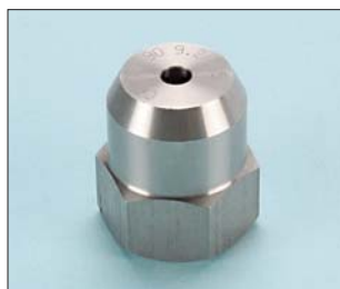
Tipo / Type O2 x