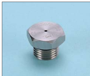
Tipo / Type O2 y