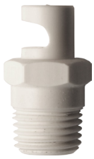
Dysze spłukujące szerokokątne