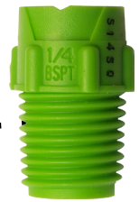
Dysze pełnego stożka