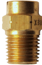
Dysze płaskostrumieniowe pełna gama